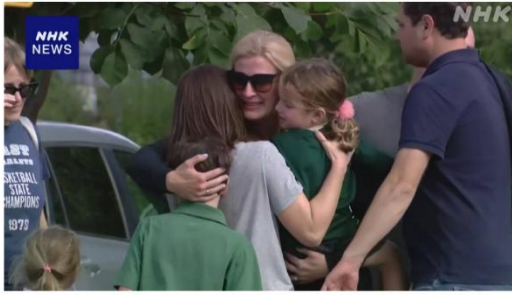
米ミネソタ州 学校教会で銃乱射 子ども2人死亡 17人けが

不審者侵入想定避難訓練（ロックダウン）を行います。この時間帯は10分間、全校でドアをしめて避難しますので、外部からの入館もできず、事務室の対応や図書室の利用もできません。遅刻・早退の予定がある場合は、事前に担任へ時間をお知らせください。8月27日に、ミネソタ州で銃撃事件があったことは、皆様もご承知